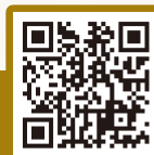
▲「につぼんの宝物」紹介動画