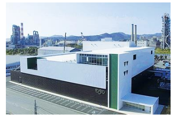
「魅せる工場」をコンセプトに最新型設備を導入し建設されたモンダミン工場

【視察先】アース製薬株式会社 赤穂工場 (赤穂市西浜北町 1122-73) 及び 研究所 (赤穂市坂越 3218-12)